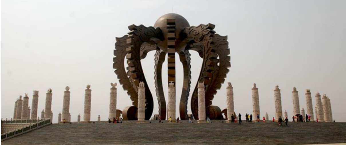
立在黄帝城里的龙祭坛