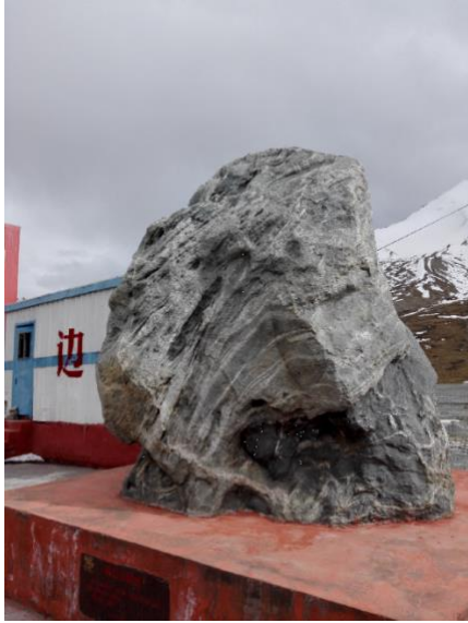
红其拉甫国门前的石头

去年八月，我们号角响起的七位代祷将领们进了河北涿鹿黄帝城，那是我们华人先祖相互杀戮之地，也是龙的起源之地。我们在神面前为我们的先祖的所犯的罪认罪悔改，对各样的祭坛作属灵拔出拆毁洁净的祷告及属灵的先知性行动。每祷告处理完一处，天上就显出一个超自然的记号！